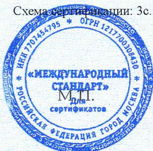
Схема сертификации: Зс.